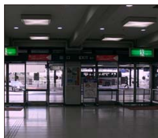
②正面に空港ターミナル出口があります。