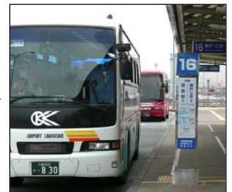
④16番「神戸(三宮)」行きにご乗車ください。