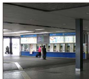
③出口を出て右に進むと券売機があります。