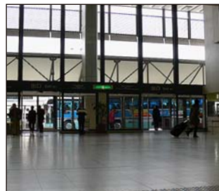
②正面に空港ターミナル出口があります。