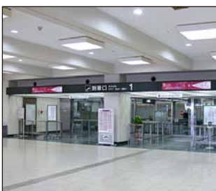
①北ターミナルに到着します。荷物を受取り到着ロビーへ。