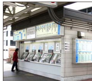
③出口を出て右に進むと券売機があります。