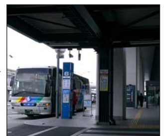
④6番「神戸(三宮)」行きに乗車ください。