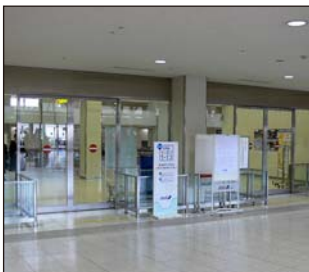
①南ターミナルに到着します。荷物を受取り到着ロビーへ。