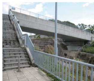
バスを降りて、左側の階段を上がります。