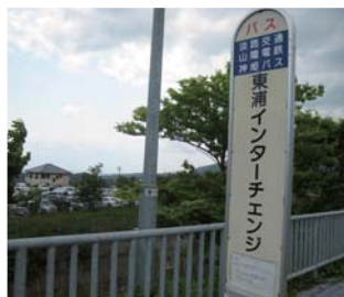
東浦インターチェンジバス停で下車します。