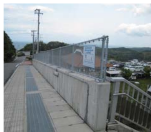
階段を上がり、右に下ります。