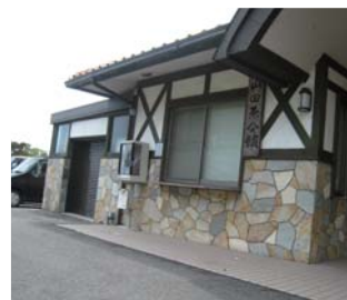
30mほど下ると右手に見えてくるのが山田原会館です。正面玄関脇の公衆電話でタクシーをお呼びください。